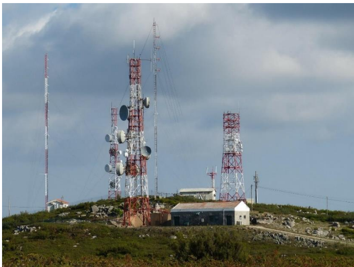
Figura 1. Estação Rádio Base

A geolocalização também pode ser capturada pelas antenas das Operadoras de Celular. Os aparelhos celulares comunicam-se com as antenas ERB – Estação Rádio Base (Figura 1) através de interface de radiofrequência, sendo possível visualizar o nível de sinal de nosso aparelho celular de acordo com a proximidade de uma ERB.